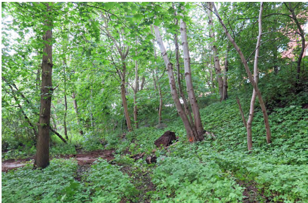
Figur 5. Lövträd, däribland många fruktträd, karakteriserar området. Utredningsytan sluttar brant ned från bostadsbebyggelsen i väster, se övre högra hörnet i bild. Foto mot söder.