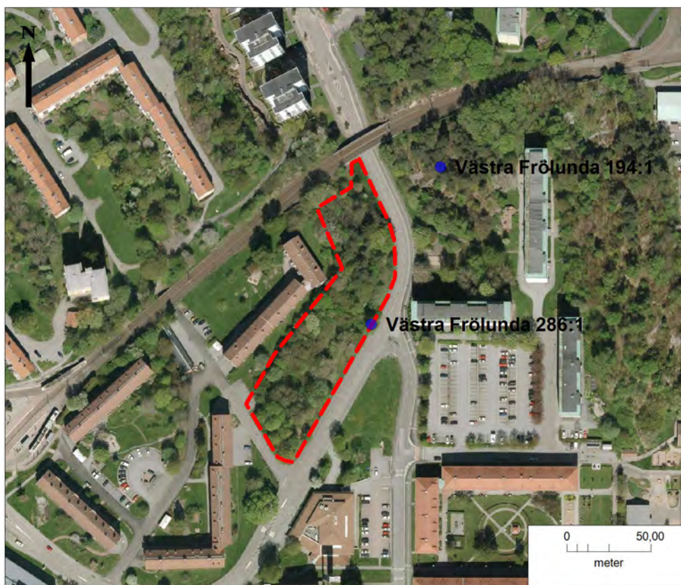
Figur 3. Utredningsområdets läge mellan Högsbogatan och Nickelmyntsgatan. Fyndplatsen Västra Frölunda 286 och stensättningen Västra Frölunda 194 markerade med blått.

Omkring 25 m öster om utredningsområdet, på andra sidan Högsbogatan, ligger en stensättning (Västra Frölunda 194, figur 3). Denna gravlämning ligger ca 28 m över havet och därmed på samma nivå som delar av utredningsområdet. I övrigt