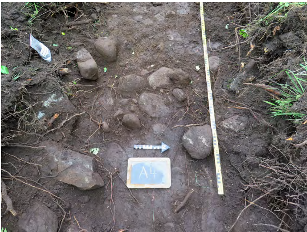
Figur 12. Den mindre stenpackningen A4 i schakt S11, mot väst.