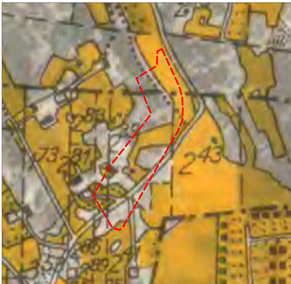
Figur 6. Ekonomiska kartan från 1934 visar att området under denna tid ännu utgjorde ett utkantsområde med småskalig odling och trädgårdar utanför stadens gränser. I söder korsar en landsväg området.

Inför fältarbetet studerades äldre kartor över området samt de arkivhandlingar som berör tidigare fynd. I fält undersöktes området genom sökschaktning med en mindre grävmaskin. Schakt och anläggningar inmättes med RTK-GPS samt dokumenterades med foto och beskrivning. I samband med framrensning av anläggningar och kulturlager tillvaratogs en mindre mängd fynd. Inga anläggningar undersöktes.