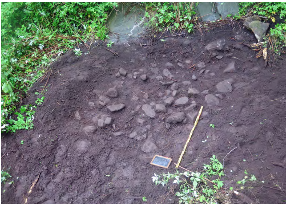
Figur 10. Stenpackningen A2 i schakt S9, foto mot väst. I bildens övre del syns berget där det börjar slutta uppåt mot bebyggelsen på Nickelmyntsgatan.