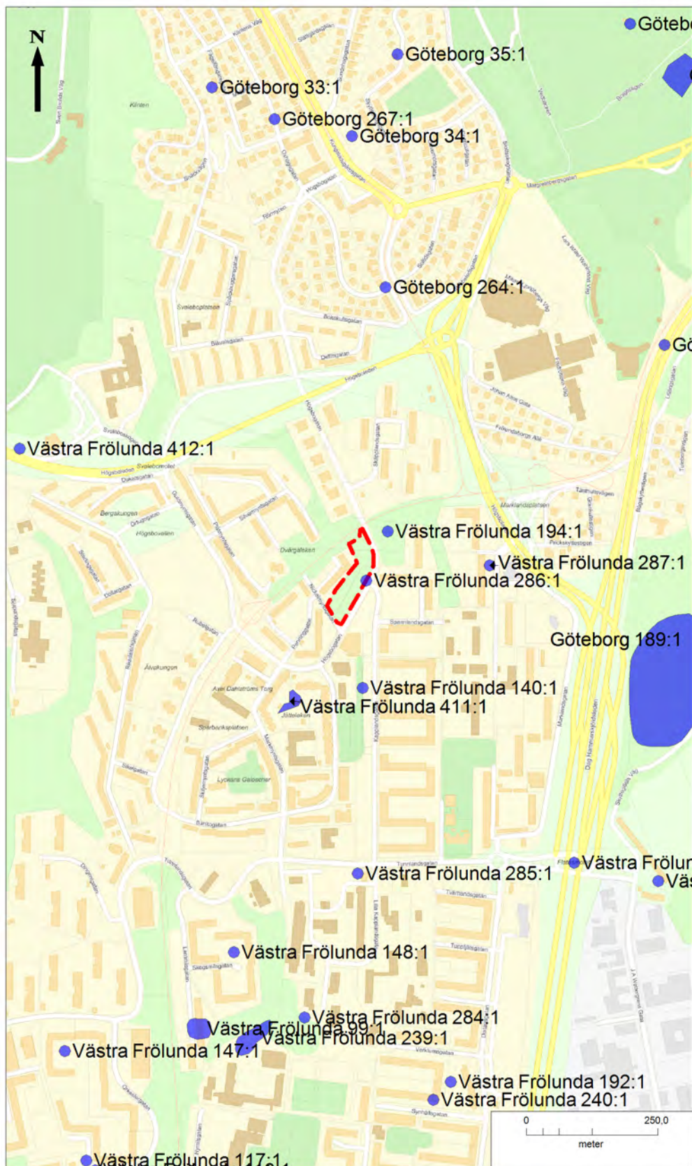
Figur 2. Utredningsområdets läge på Stadskartan. Fornlämningar markerade med blått. Skala 1:10 000.