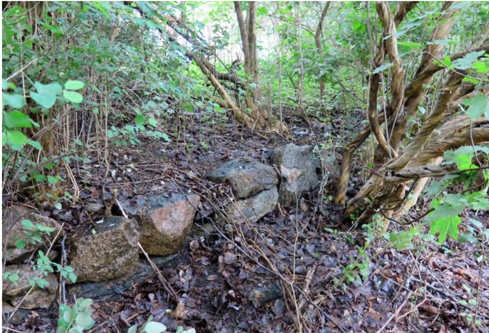
Figur 17. Den murade terrasseringen i områdets sydvästra del. I bakgrunden ligger den befintliga bebyggelsen på Nickelmyntsgatan. Foto mot nordväst.

En mindre mängd keramikskärvor tillvaratogs också från den södra bopplatsen, Göteborg 522. Keramiken är mycket fragmenterad men ger ett generellt brons-/äldre järnåldersintryck.