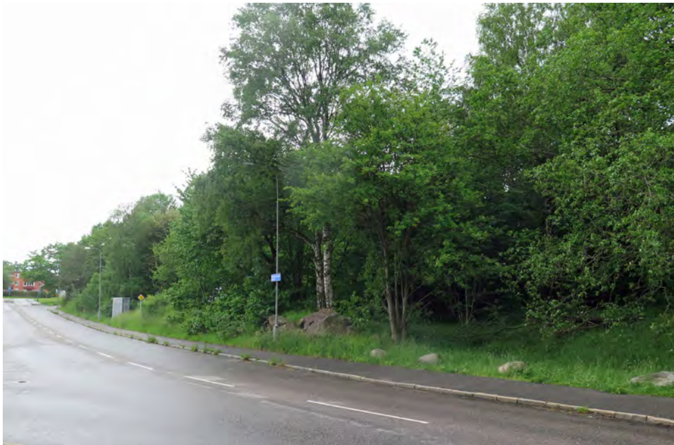
Figur 4. Utredningsområdet fotograferat från Högsbogatan, mot sydväst.

finns enstaka förhistoriska fynd- och boplatser i närheten. Här kan särskilt nämnas Västra Frölunda 411, ca 150 m söder om det nu aktuella området. Denna boplatser undersöktes 2007 och gav dateringar till brons- och äldre järnålder (von der Luft 2007). I närheten finns även en skålgropslokal (Västra Frölunda 140). I övrigt kan man bland annat nämna fornborgen Göteborg 189 i de närbelägna Änggårdsbergen, ca 500 m österut. Där finns också ytterligare gravar i form av stensättningar och rösen. De närliggande fornlämningarna indikerar således att landskapet här särskilt använts under brons- och äldre järnålder.