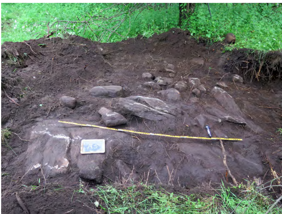
Figur 11. Stenpackningen A3 i schakt S11, mot norr. I förgrunden syns berget gå i dagen.