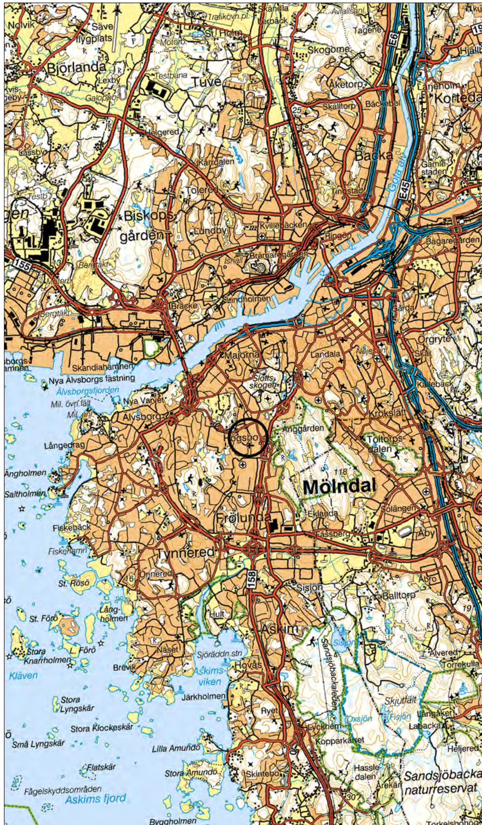
Figur 1. Utredningsområdets läge i Högsbo, sydvästra Göteborg. Vägkartan, skala 1:100 000.