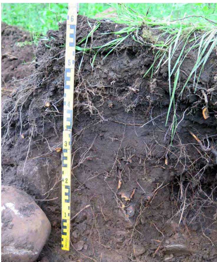
Figur 13. Kulturlagret i schakt S11.