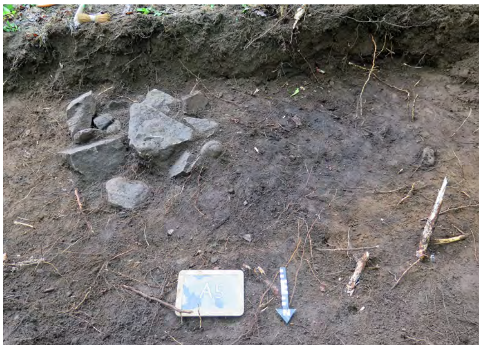
Figur 15. Anläggning A5, kokgrop, i S13. Foto mot söder.