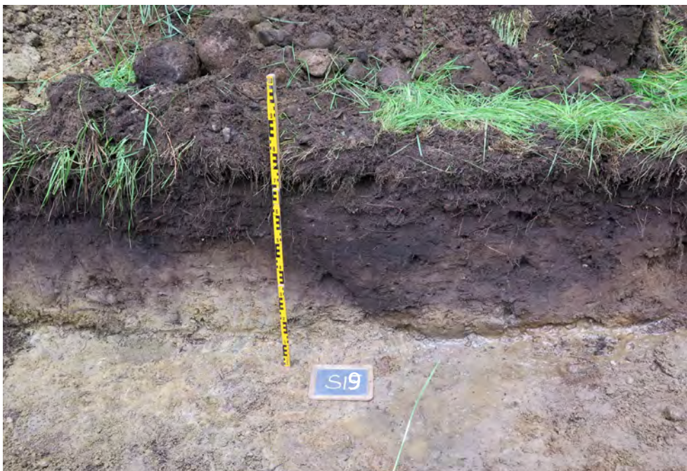
Figur 16. Kulturlager i S19. I originalfotot står felaktigt schaktbeteckningen S15.

anläggningar noterades under kulturlagret; en mörkfärgning, ca 0,35 m i diameter (A7) samt en mindre, oregelbunden stenpackning (A8), endast 0,5 x 0,3 m stor. Ett tjugotal flintor påträffades i både matjorden och kulturlagret.