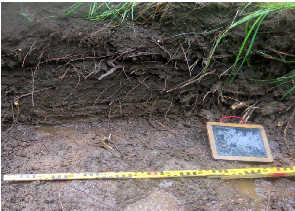
Figur 9. Ca 20 cm tjockt kulturlager i schakt S6. Kraftigt regn försvårade dokumentationen.

Även i S11 påträffades två stenpackningar. Den ena anläggningen (A3, figur 11) utgjordes av en oregelbunden packning, ca 3,5 x 3,0 m synlig storlek, av 0,1-0,5 m stora stenar. Stenarna var delvis lagda mot en uppstickande bergklack och enstaka större hållar kan utgöra markfasta block eller berg. Utöver stora mängder avslag påträffades även ett retuscherat avslag och en knacksten i flinta ytligt i packningen. En mindre stenpackning (A4, figur 12), ca 1,0 x 0,8 m stor, påträffades strax öster om A3. Denna anläggning var oregelbunden och svåravgränsad. Enstaka slagen flinta framkom vid rensning. Över de båda anläggningarna låg ett gråbrunt kulturlager av sandig humös silt, möjligen ett äldre odlingslager (figur 13).