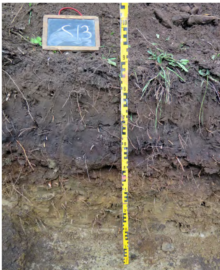
Figur 14. Kulturlagret i schakt S13.